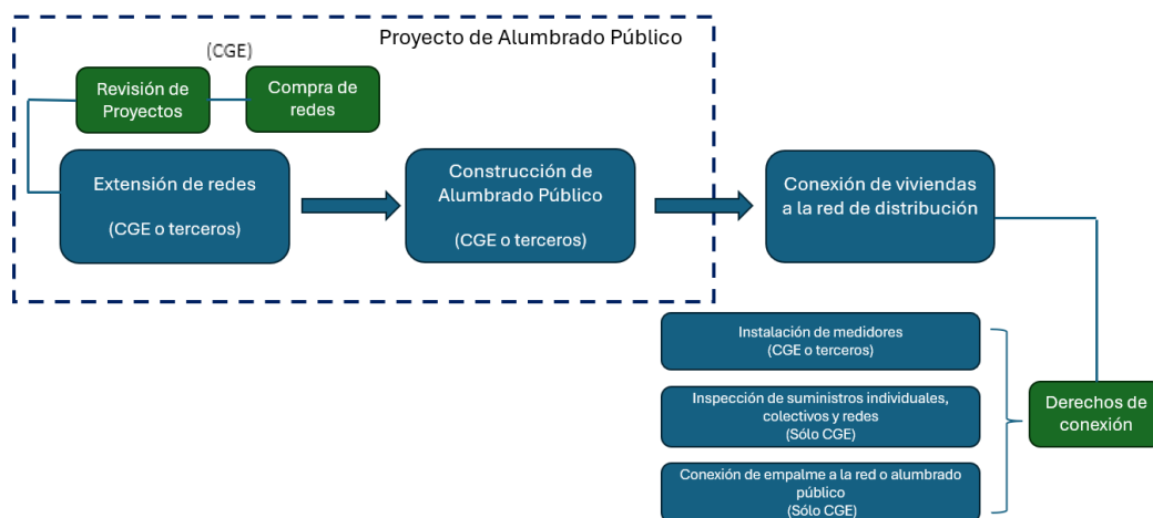
FIGURA N° 1 Servicios complementarios a la distribución eléctrica considerados en la demanda y prestadores que pueden ejecutarlos